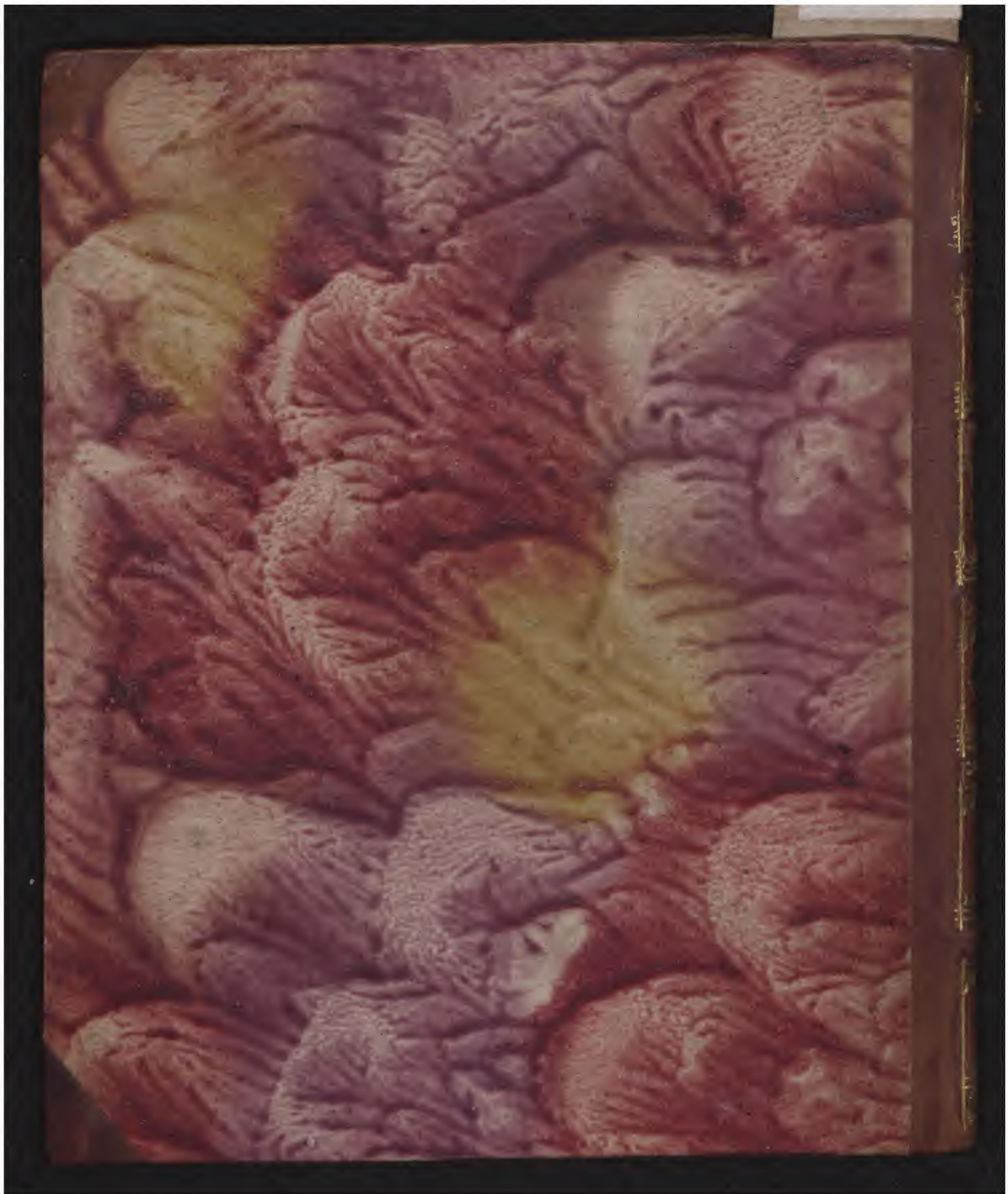
Early European Books, Copyright © 2009 ProQuest LLC. Images reproduced by courtesy of the Royal Library, Copenhagen. Hielmst. 193 4° (LN 1475 4° copy 2)